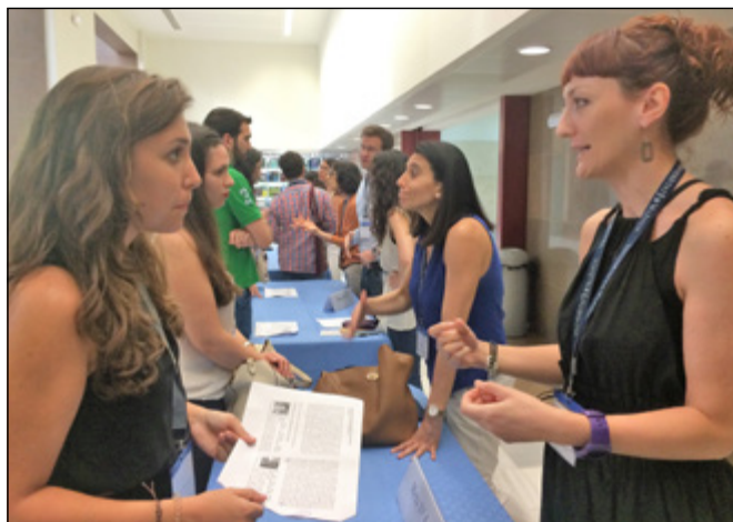
El programa IMP conecta a estudiantes con profesionales internacionales de su área

ción, liderazgo y espíritu colaborador. El objetivo de IMFAHE es contribuir a que este modelo educativo innovador creado por españoles y probado en universidades españolas, se extienda a otros países del mundo y se convierta en un programa global que permita establecer nuevos puentes de conocimiento.