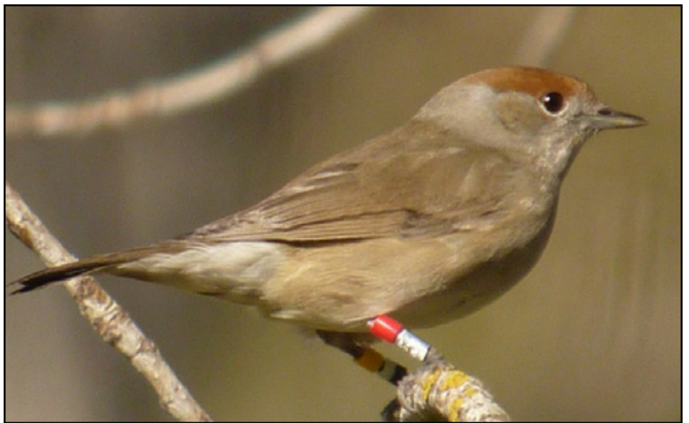
Hembra de curruca capirotada con anillas de color observada en el estudio. / Michelangelo Morganti.

Según los científicos, esta actitud podría explicarse porque tratan de defender su territorio de nidifica-