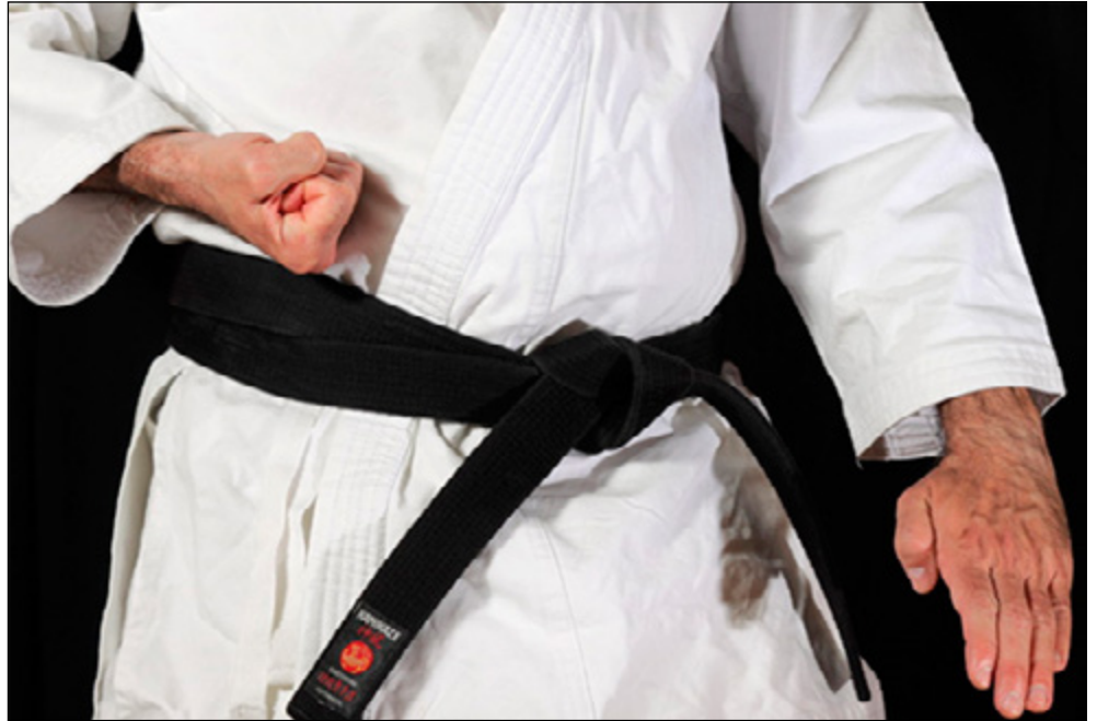
En el kárate se coordinan atención, fuerza, respiración, equilibrio, postura y movimiento.

edad media fue de 29 años, con un rango de 13 a 73 años. El 39,3% eran mujeres y el 60,7%, hombres. En todos los participantes se midió la velocidad de anticipación, es decir, que la persona anticipe su respuesta con tanta precisión que logre interceptar