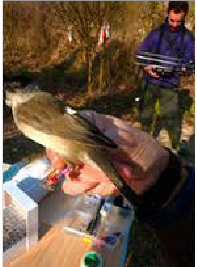
Macho de curruca capirotada con radioemisor montado en la espalda. A la derecha, un investigador con antena receptora de señales radio. / Michelangelo Morganti.

las aves residentes se mueven poco y en invierno explotan recursos alimenticios más variados porque conocen mejor el territorio